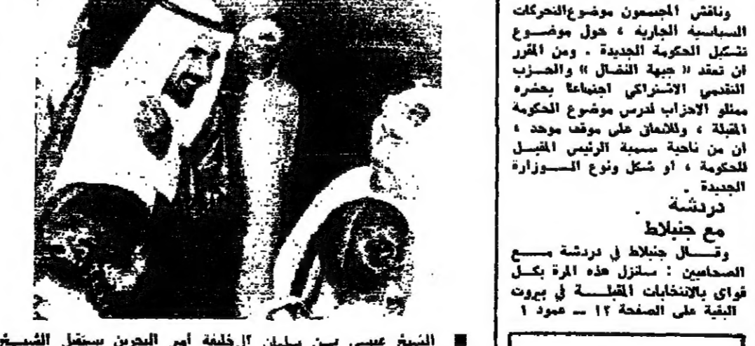
الشيخ عيسى بن سلمان آل خليفة أمير البحرين يستقبل الشيخ جابر الاحمد ولي عهد الكويت ورئيس الوزراء

صيدا - من زوره نقوزي: وافداً «ابو صسام»: اننا نريد ان نؤكد لكم، بان ليس للثورة الفلسطينية اي مطمح او مطلب في لبنان، الا انها بلسلتها وتوتنها تتجه نحو تحرير ارضها من الصهيونيين - وان الثورة ليست ضد احد، الا انها لا تسمح لاحد بان يسيدها على من ١٢ عمود ٥ -